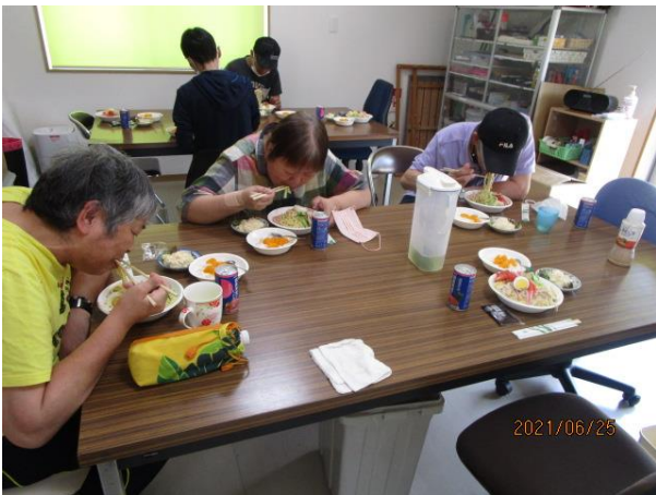
むちゅう た 夢中に食べています