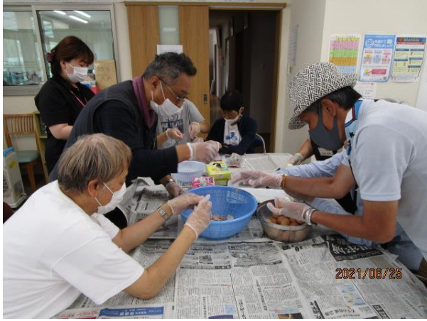
みんなで、レタスをちぎっています