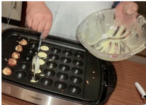
流し込むの難しい～((+_+))

次は7月9日に「鈴カステラ」を作りました。卵とはちみつを入れ、たこ焼き器で焼きました。生地が柔らかいので、たこ焼き器の中に入れるのが少し難しかったのですが、ふんわりしっとり、こちらも美味しい鈴カステラが出来ました(*^_^*)