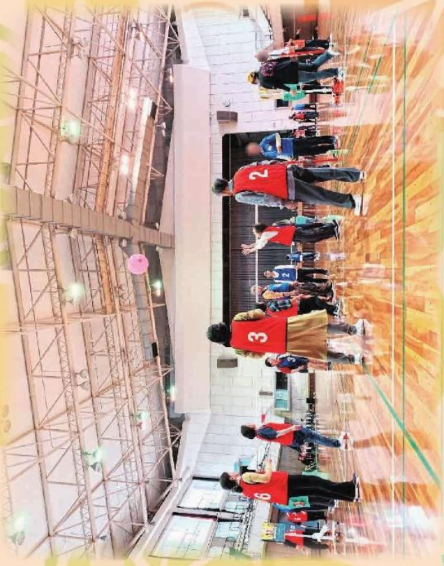
福岡県精神障害者スポーツレクリエーション大会の様子 (直方市体育館にて)