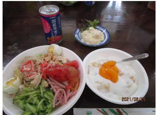
おい ひ ちゅうか かんせい 美味しそうな冷やし中華が完成しました♪