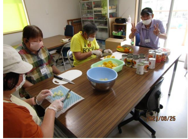
フルーチェに飾るフルーツを切っています