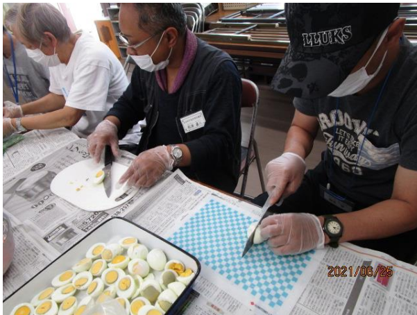
ひ ちゅうかの たまご き 冷やし中華に乗せる卵を切っています