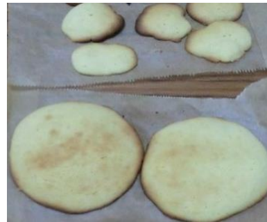
美味しいクッキー出来上がり♪

次は7月9日に「鈴カステラ」を作りました。卵とはちみつを入れ、たこ焼き器で焼きました。生地が柔らかいので、たこ焼き器の中に入れるのが少し難しかったのですが、ふんわりしっとり、こちらも美味しい鈴カステラが出来ました(*^_^*)