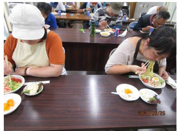
ソーシャルディスタンスを保って食べています